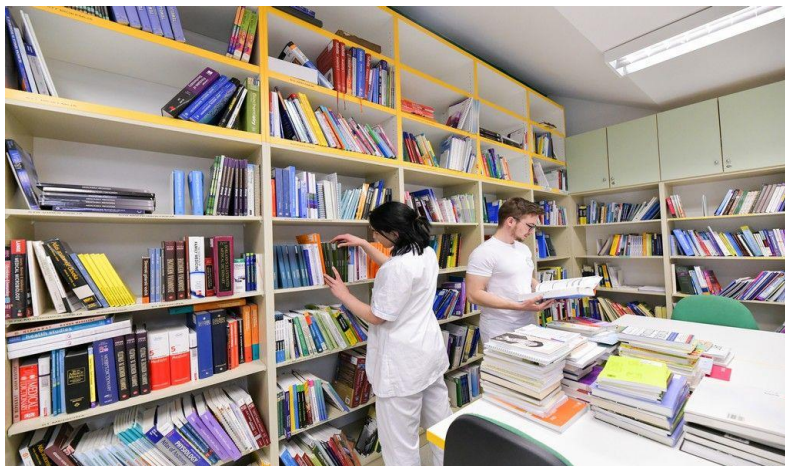
Arhiv Univerze v Novem mestu (razmik pred 0, po 6)